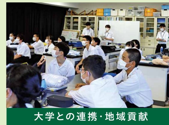
大学との連携・地域貢献

教科学習では、各教科ならではのおもしろさや魅力、その教科を学ぶ意義の実感につながる知のプロセスに参加することにより、自らを高め続ける姿勢を身に付けた生徒を育てることができると考えています。