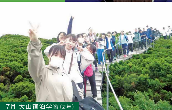
7月 大山宿泊学習(2年)